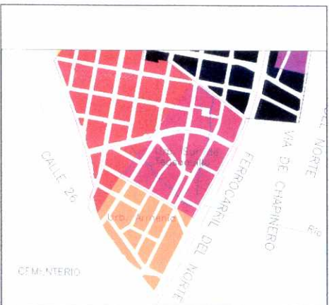
PLANO DE URBANIZACIONES

En el barrio Armenia la arquitectura encierra su espacialidad. Las manzanas de edificios sobre la calle 26 y la avenida Caracas, parecen querer establecer una muralla de protección, mientras que el otro costado, al norte, se abre con viviendas de dos pisos.